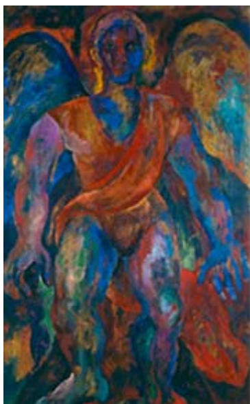
Lorenzo Jaramillo n. Colombia, 1955 - m. 1992 Ángel , 1987 Colección del Banco de la República de Colombia, Santafé de Bogotá, Colombia