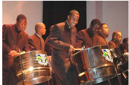
La Orquesta de las Fuerzas de Defensa de Trinidad y Tobago presentó un concierto en el Centro de Conferencias del BID en mayo de 2006.

Tecnología Andina (Perú), Video Brasil (Brasil), el Instituto Italo-Latinoamericano de Roma (Italia), el Centro León Jiménez (República Dominicana) y la Galería Nacional de Guyana, Castellani House (Guyana), entre otros.