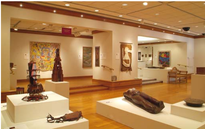
Galería de arte del Centro Cultural del BID con la instalación de la exposición “Las Artes de Guyana: Una Aventura Multicultural en el Caribe”.