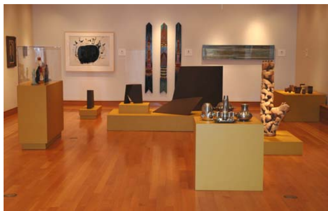
Panorámica de la exhibición titulada "Un Bello Horizonte: Las Artes de Minas Gerais, Brasil", presentada en la galería de arte del Centro Cultural del BID de febrero a mayo de 2006.

CNN, Caracol y numerosas emisoras de radio y periódicos, tanto en Chile como en el resto de América Latina y España. El segundo evento fue la première en Washington de La fiesta del chivo , película basada en la magnífica novela de Mario Vargas Llosa, con la actuación y la presencia de Isabella Rossellini, estrella del filme, y del director peruano Luis Llosa. La prensa de Estados Unidos, América Latina y España se hizo amplio eco de este importante acontecimiento cinematográfico.