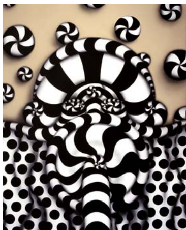
Ascendente geométrico 2002, por el artista Diego Masi, nacido en Montevideo, Uruguay, 1965 —, acrílico sobre tela, 139.7 x 170.18 cm, pertenece a la Colección de Arte del BID.

Rica: Prensa Libre, La Nación . Cuba: Prensa Latina . Ecuador: La Nación . Guyana: Guyana Chronicle, Caribbean Voice, Caribbean Consulting Group, Guyana Times, Kaieter News, Caribbean TV, Hard Beat News, Guyana TV Channels 11, 6, 7 . México: Vanguardia . Nicaragua: El Nuevo Diario, La Prensa . Panamá: La Prensa, El Siglo . Paraguay: ABC, Última Hora, La Nación, El Mirador Paraguayo . Perú: 24 Horas . Surinam: Dagblad, Times . Uruguay: Semanario Búsqueda . Venezuela: Agencia Bolivariana de Noticias ABN, Unión Radio.