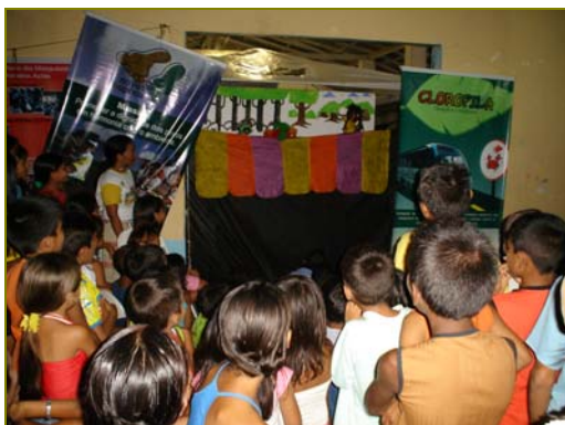
PDC 2006 Brasil: el Grupo de Acción Ecológica Novos Corupiras visitaron varias comunidades en los Mangles del Estado de Pará promoviendo la protección de su medio ambiente al resaltar las tradiciones populares locales con sesiones educativas y teatro de títeres.